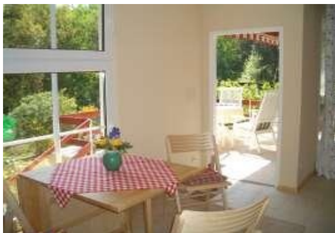
Frühstücksecke im Häuschen Seeblick

In Schlafzimmer 2 steht ein Etagenbett, Betten sind bezogen, Handtücher vorhanden, Küche mit kompletter Ausstattung: Geschirrspüler, Mikrowelle, Espressogerät, Kaffeemaschine, Bad mit Dusche/WC, Fön, Terrasse mit Markise und Gartenmöbeln, Doppel-Deckchair, Holzkohlengrill, Karten und viel Infomaterial liegen bereit,