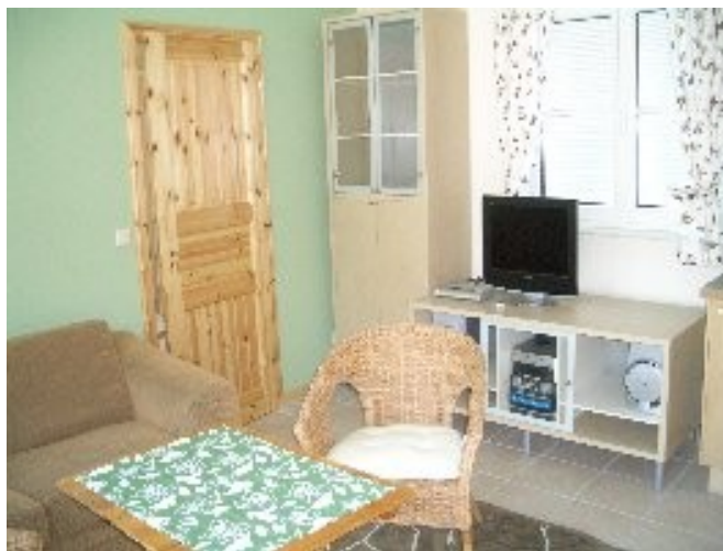
Wohnzimmer im Häuschen Sonnenblick

PKW-Stellplatz, Terrasse, Wohnzimmer mit DVB-T Flachbild-Fernseher und Stereoanlage, ein Schlafzimmer mit Doppelbett, Schlafsofa im WZ, Klimagerät, Betten sind bezogen, Handtücher vorhanden, Küche mit kompletter Ausstattung, Geschirrspüler, Mikrowelle, Kaffeemaschine, Espressogerät, Bad mit Dusche/WC, Fön, Terrasse mit Markise und Gartenmöbeln, Strandkorb, Holzkohlengrill, Karten und viel Infomaterial liegen bereit